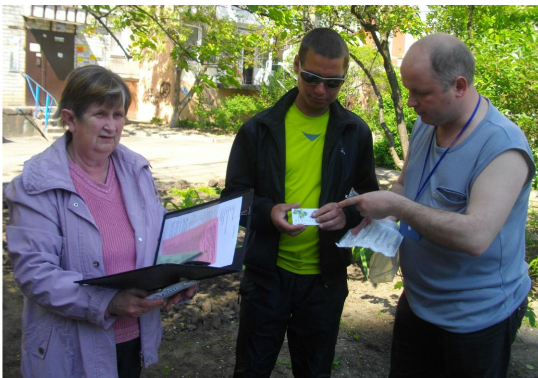
Работа ПОШ «Намыв». Консультирование, выдача шприцев и др.