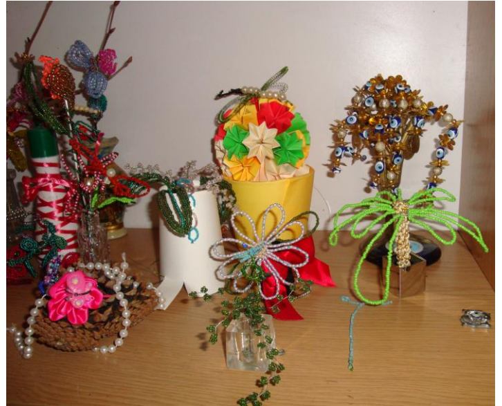
Результаты творчества участников групп творческой терапии.