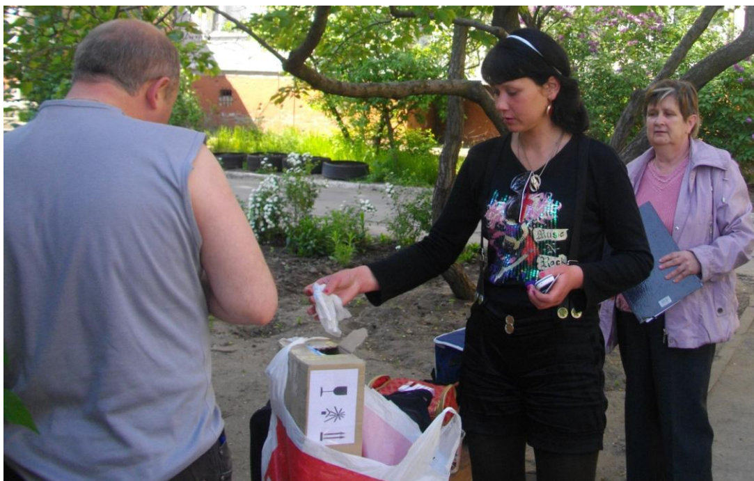
Работа ПОШ «Намыв». Сбор использованных шприцев.